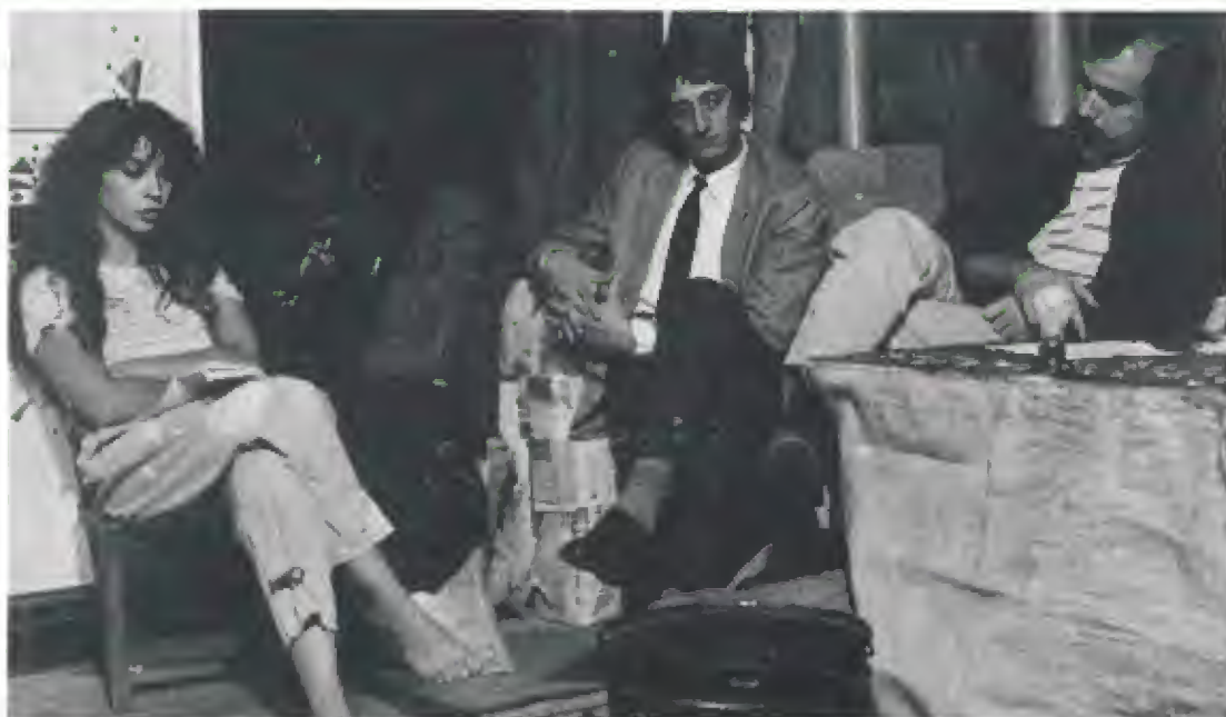
Patricia Adriani - Enrique San Francisco - Antonio Resines